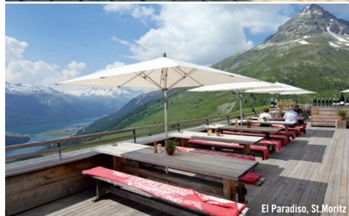
El Paradiso, St. Moritz