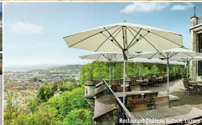
Restaurant Château Gütsch, Luzern

In der Lounge oder an der Bar: Der kleine FORTINO® steht dort, wo Schatten gefragt ist. Dank seiner Grösse wechselt er den Platz schneller als ein Wanderpokal seinen Besitzer. Für Bedienkomfort sorgt das gegenläufige Servo-Prinzip: Einfach den Spannhelb nach unten ziehen und im Schieber einhängen. Das Gestell ist aus natureloxiertem Aluminium mit einem zweiteiligen profilierten Mast. Stabil konstruiert, ist der FORTINO® windrobust und kann in diversen Sockeln oder in einer Bodenhülse befestigt werden.